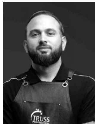
ASIL Embajador Global @asil